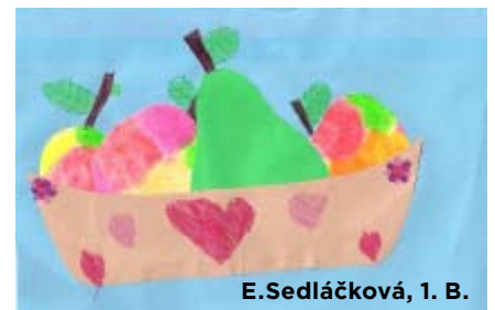
E. Sedláčková, 1. B.

Také letos probíhá sběr papíru pod názvem ZELENÝ STROM. Naše škola se s nadšením do této akce opět